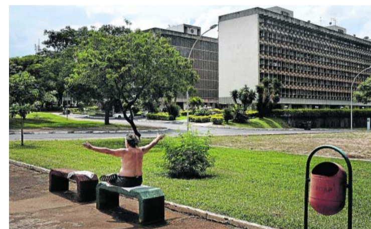
Mies joogasi puistonpenkillä pääkaupungin pohjoisrannalla. Taustalla näkyy betonisia asuintaloja.