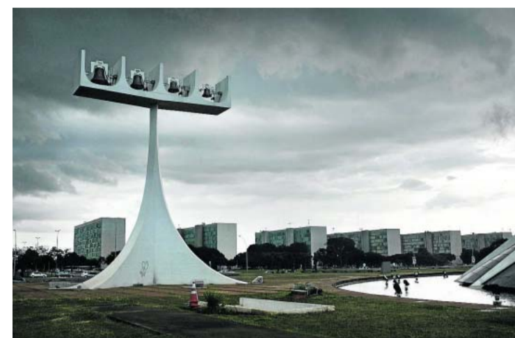
Pääkatedraalin kello taustallaan ministeriöiden reunustama Esplanada dos Ministérios.

Kylmän sodan aikaan silloinen Tšekkoslovakia esti rajanylitykset silloiseen Länsi-Saksaan. Rajavyöhyke oli varustettu sähköaidoin. Saksanhirvien elinalueet ovat periytyneet, koska hirvet elävät keskimäärin 15-vuotiaiksi. HS