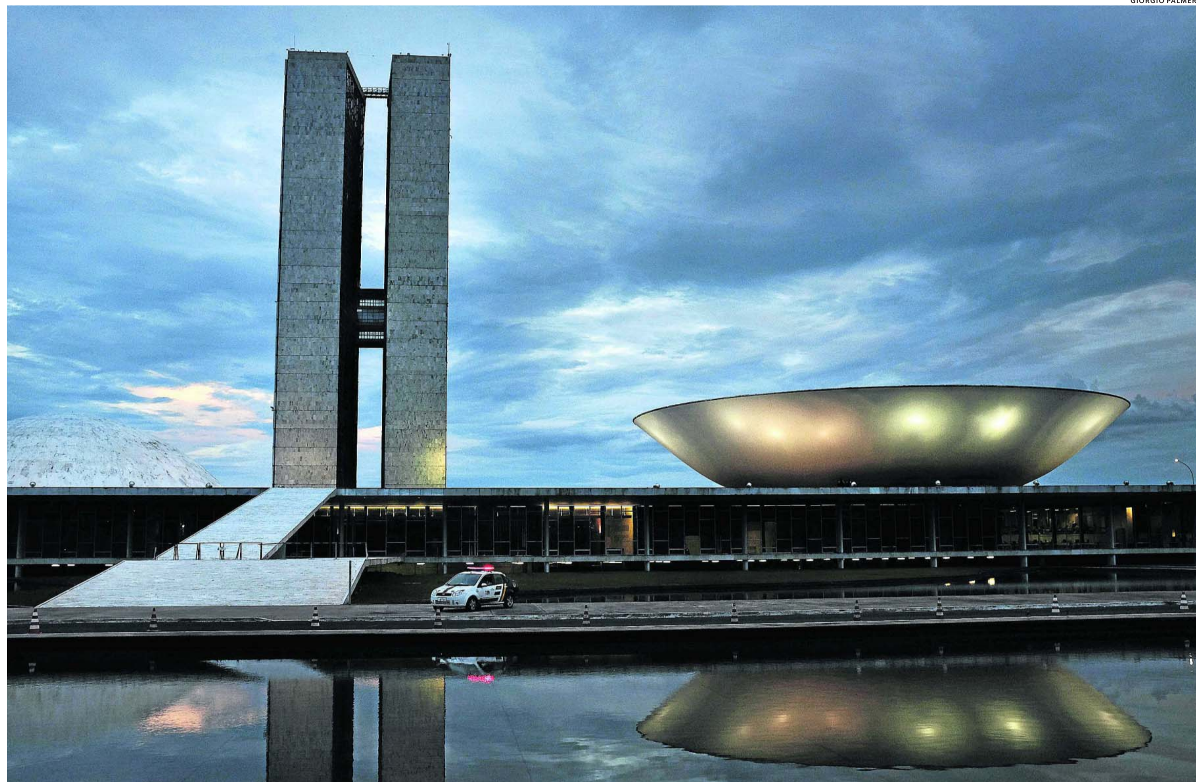
Arkkitehti Oscar Niemeyerin suunnittelema parlamenttirakennus Brasíliassa. Futuristinen pääkaupunki on yksi kesäkuussa alkavan jalkapallon MM-turnauksen pelipaikoista.