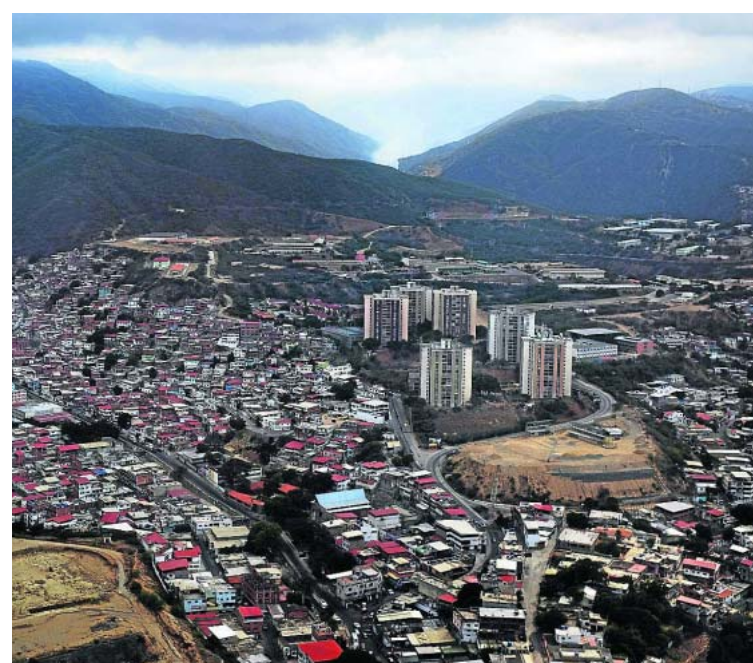
Venezuelan pohjoisosissa sijaitsevassa Caracasisa asuu yli kolme miljoonaa ihmistä.

luen riveistä kansanedustajaksi 27-vuotiaana. Sosiaaliministeriksi hän nousi liki puoli vuotta sitten, kun reformipuolue joutui vaihtamaan ministereitään vaalirahaskandaa-